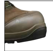
HAIX® Nano-Carbon Schutzkappe